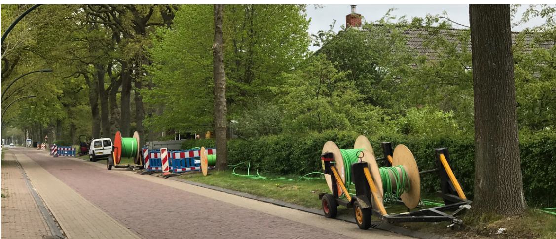
Aanleg in Gasteren: de kabel wordt getrokken langs het Oosteinde

In februari 2021 kan de laatste aansluiting worden gemaakt in Eelderwolde. In anderhalf jaar is heel NO Drenthe voorzien van een prachtige glasvezel-internet structuur, met in deze fase meer dan 5000 aansluitingen en voor de toekomst kansen voor nog eens 5000 huishoudens.